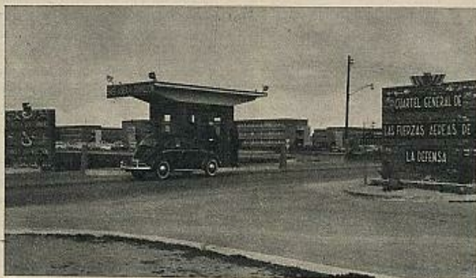
Base aérea de Torrejón.

Una vez completada la construcción de las bases en 1957, los Estados Unidos empezaron a estacionar más de 10.000 soldados en territorio español y a emplear alrededor de 5.000 españoles. Sus salarios representaron la parte más importante del coste total de operación y mantenimiento de las bases, los cuales rápidamente alcanzaron una cifra superior a los cien millones de dólares anuales. Resulta imposible conocer qué parte de los 2.500 millones de dólares, que se estima fueron invertidos por los Estados Unidos para el funcionamiento de sus bases en España, fue canalizada hacia la economía española entre 1954 y 1975; pero aunque no fuera más de la mitad, esta cifra representaría una aportación considerable, especialmente en la segunda mitad de la década 1950-1960, en que la Balanza de Pagos española atravesaba por grandes dificultades (el cuadro 3 puede dar una idea de este impacto).