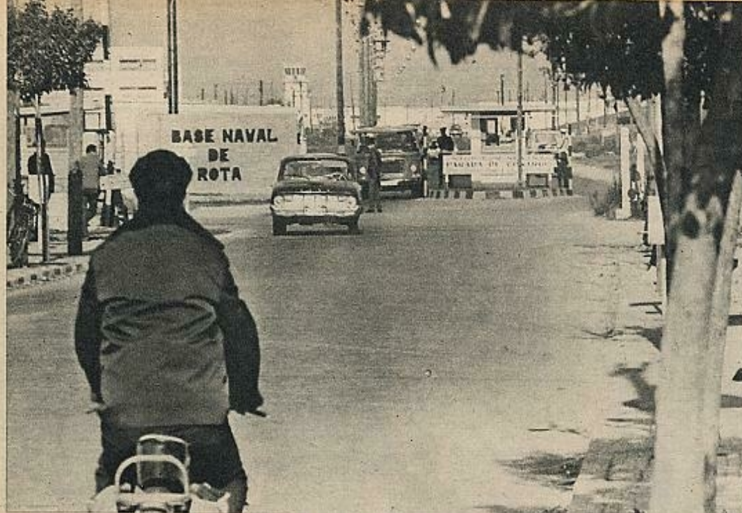
Base naval de Rota.

ventas de armas de Estados Unidos a España eran inexistentes; por el contrario, en el período 1970-74 las ventas de armas (con un valor de 413,6 millones de dólares) representaron el 60 por 100 del valor total de la ayuda militar. De hecho, desde 1965, una gradual disminución en los programas de asistencia militar (cuadro 2, núms. 1-3) fue acompañada por un incremento en la venta de armas (núms. 4 y 5). Dos fueron las razones para este cambio de donaciones a ventas: