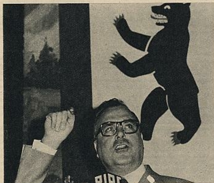
Kohl: un liberal más bien ambiguo.

litar. Parece fascinado por la figura de Caramanlis: se reprocha a este hombre de pensamiento propio, intelectual, por ahogar sus propias ideas para seguir las de su jefe político, al que se atribuye una capacidad práctica pero no ideológica en la política. Ello hace pensar que el presidente de la República no sería más que un instrumento en manos del jefe de gobierno, y que incluso si un día Caramanlis encontrara más seguridad y más permanencia para su poder en la presidencia, Tsatsos no vacilaría en ofrecerle su cargo. Aparte de este reproche, la figura del nuevo presidente, en tanto que pensador y que hombre de moral y honestidad comprobadas, y de una gran historia de dignidad cívica bajo la dictadura es comúnmente aceptada por todos en Grecia. ■