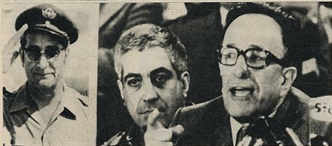
El triunvirato supone en principio una cesión de fuerza de uno de los triunviros, el general Costa Gomes, así como un ascenso noble del jefe del Copcon, Saraiva de Carvalho. A la derecha de la fotografía, el primer ministro y tercer hombre, Vasco Gonçalves, el más odiado por Soares, los partidos del centro y la derecha.