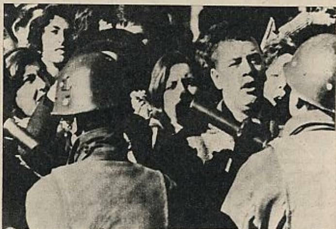
Un momento de la manifestación de la ultraderecha peronista, con motivo del vigésimo tercer aniversario de la muerte de Eva Perón, celebrada a pesar de la prohibición oficial.

cuarteles pueden provocar en cualquier momento una intervención militar, tan dura como para acabar con el Régimen definitivamente. Muchos se preguntan cómo el Ejército no ha hecho oír todavía su voz en este concierto cacofónico. Probablemente, el Ejército sabe que su posible toma de poder significaría recoger la herencia catastrófica de estos dos años de peronismo desenfrenado, y tampoco hay unanimidad en los mandos militares acerca del «tono» político que se podría dar a su posible golpe de Estado. Sobre todo, cuando el Ejército es-