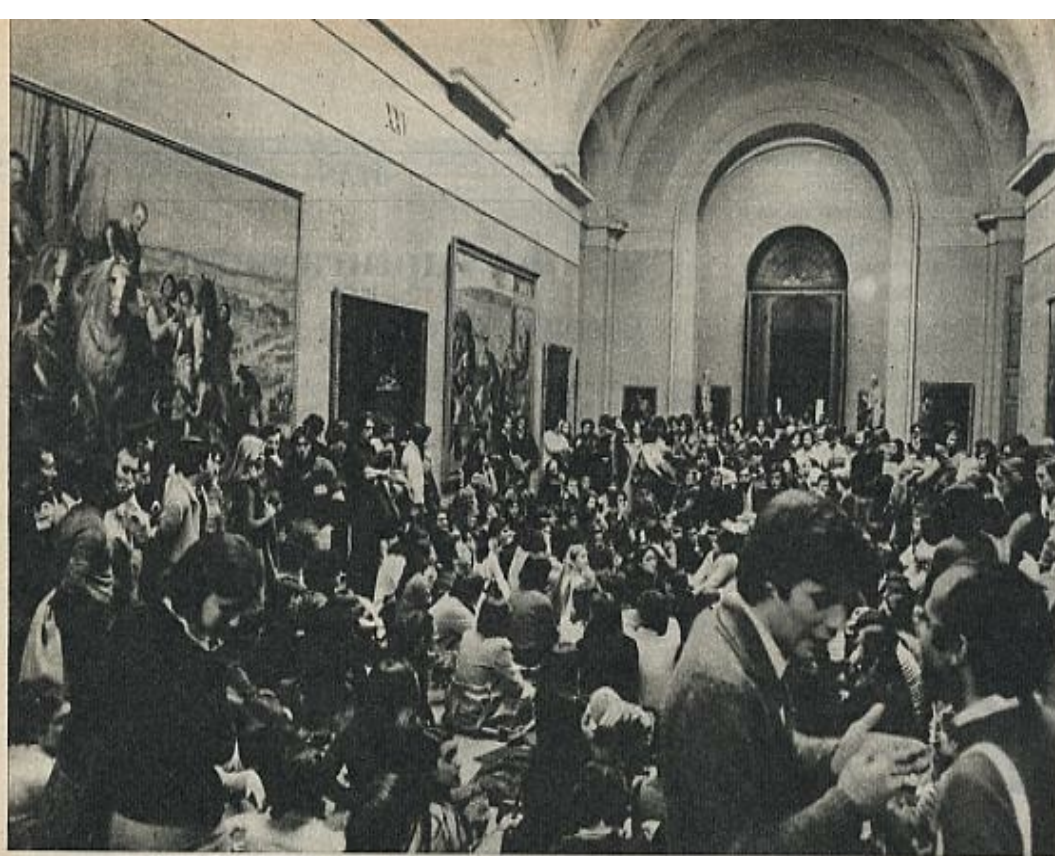
Estudiantes y profesores, en la galería central del Prado: seis horas de encierro.