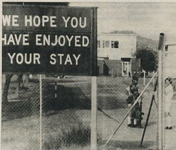
El cierre de la frontera mozambiqueña con Rhodesia puede ser el principio del fin del régimen racista de Ian Smith.

¿Es el final de la Rhodesia blanca? Puede ser el principio del final, pero no cabe duda de que Rhodesia va a recibir una importante ayuda de África del Sur, cuyo destino es equipara-