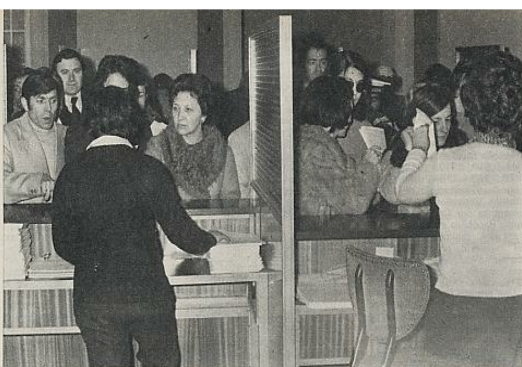
Un sistema como el español, conservador y autoritario en lo político, oligárquico en lo económico y guiado por una visión miope de beneficio a corto plazo, no admite un sistema fiscal progresivo ni una inspección que recaiga precisamente en los detentadores del poder. En la fotografía: recogida de impresos para la declaración de Hacienda.

de una forma diferenciada, a las distintas clases sociales.