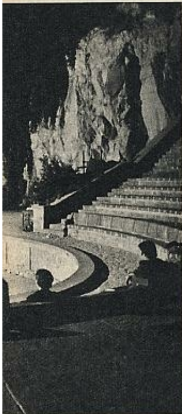
ente el teatro Grec, un teatro abierto en e le obliga el teatro burgués.