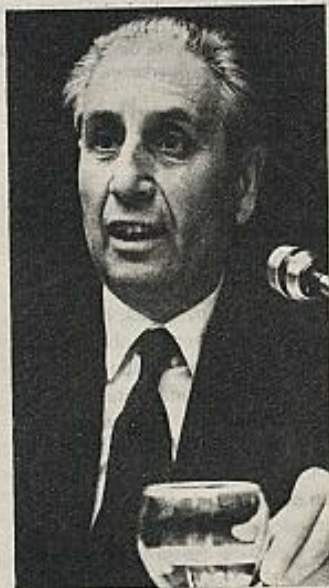
Viola, un eslabón debilísimo.

Viola ha estado en Madrid. Los rumores sobre su cese o dimisión han quedado un tanto sepultados bajo los rumores de ceses o dimisiones más fundamentales. Pero lo importante de los rumores que hacen referencia a Viola es que llevan aparejados el nombre de Antonio de Senillosa como posible sucesor. Senillosa es un monárquico de toda la vida al que algún gobernador civil de épocas más heroicas calificó de "marxista monárquico". En su época de