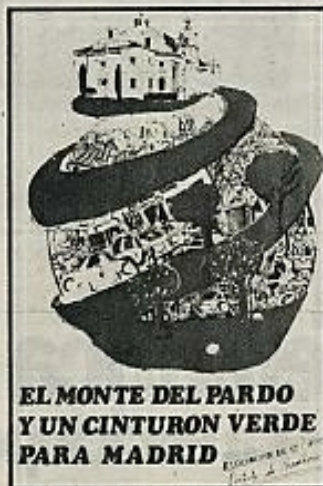
EL MONTE DEL PARDO Y UN CINTURON VERDE PARA MADRID

Regado por el Manzanares (casi sin contaminar) durante unos 10 km., tiene en su interior, además, un embalse de regulación, con más de 15 km., de costa. Y en cuanto a la fauna... Los centenares de ciervos y gamos existentes, a pesar de haber sido tiroteados impunemente durante muchos años,