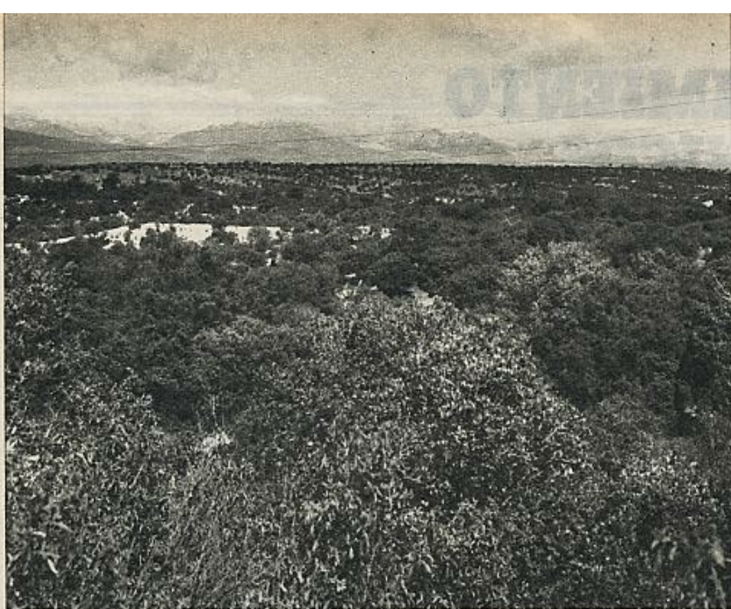
No puede plantearse la opción entre monte e instalaciones colectivas de esparcimiento, sino que el pueblo madrileño necesita y quiere ambas cosas.

muestran cierta afabilidad, no siendo difícil verles, incluso hoy, en cualquier atardecer. Cuando los Trastamara aún se mataron osos, hace cincuenta años se vieron lobos y hace no más de cinco, un águila imperial de las últimas que por allí rondaban fue abatida ("vox populi") por Francisco Franco Martínez-Bordó.