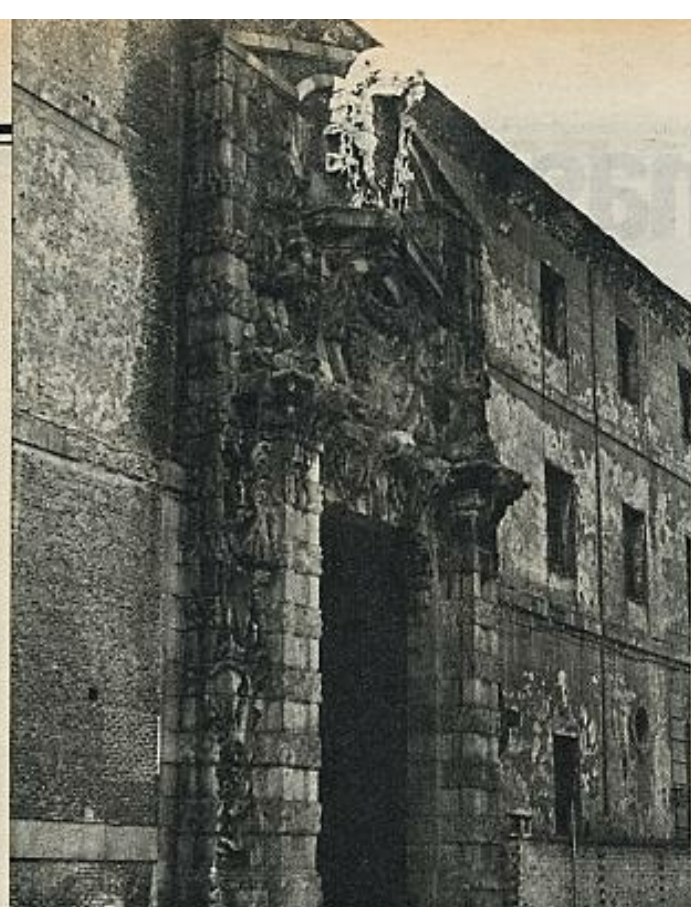
El Cuartel del Conde Duque, declarado monumento histórico-artístico. A su salvación ha contribuido eficazmente el Colegio Oficial de Arquitectos de Madrid. En la foto, el portal, obra de Pedro de Ribera.