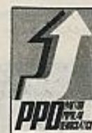
PPD (Partido Popular Democrático)

Fundada en diciembre de 1973. Miembro de la IV Internacional (trotskista). El año pasado vino Ernst Mandel a sus comicios. Piden control obrero de las empresas, comités de soldados, etcétera. Atacan las elecciones, aunque las usan como propaganda. Consideran al PS y al PCP como reformistas y servidores del capitalismo para engañar al pueblo. Piden un congreso democrático de todos los sindicatos para avanzar hacia la revolución de la clase obrera, atacada en su combate por "el reformismo de ciertos partidos que marcan y desmarcan huelgas". En 1975 lograron 10.732 votos.