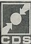
CDS (Partido de Centro Democrático Social)

Su primer congreso lo celebró en diciembre de 1974, aunque sus orígenes se remontan a cuatro años antes con las reuniones de intelectuales de izquierda. En su campaña señala la acentuación del giro a la derecha después del 25 de noviembre y llama la atención sobre los partidos fascistas o fascitizantes como PDC, PPM, PPD y CDS. Pide la unidad de la izquierda revolucionaria. En 1975 tuvo 57.682 votos.