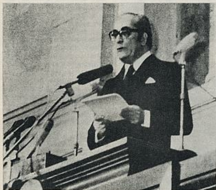
La Constitución condiciona la marcha al socialismo hasta 1980 y en este sentido puede considerarse como una victoria de la izquierda. En la fotografía, el Presidente Costa Gomes durante su alocución a la Asamblea Constituyente el 3 del pasado marzo.

Los cuatro grande partidos van por libre. Unos porque quieren y otros porque no tienen más reme-