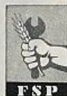
FSP (Frente Socialista Popular)

mo. No ha participado en los Gobiernos provisionales y ha criticado la política de nacionalizaciones, la reforma agraria y el control obrero. Impugnó el voto global de la Constitución. El general de la Fuerza Aérea Galvão de Melo (uno de los cinco miembros de la Junta de Salvación Nacional) es uno de sus líderes. Está implantado fuertemente en el Norte del país y logró el cuarto puesto en las elecciones del 75, con más de cuatrocientos mil votos.