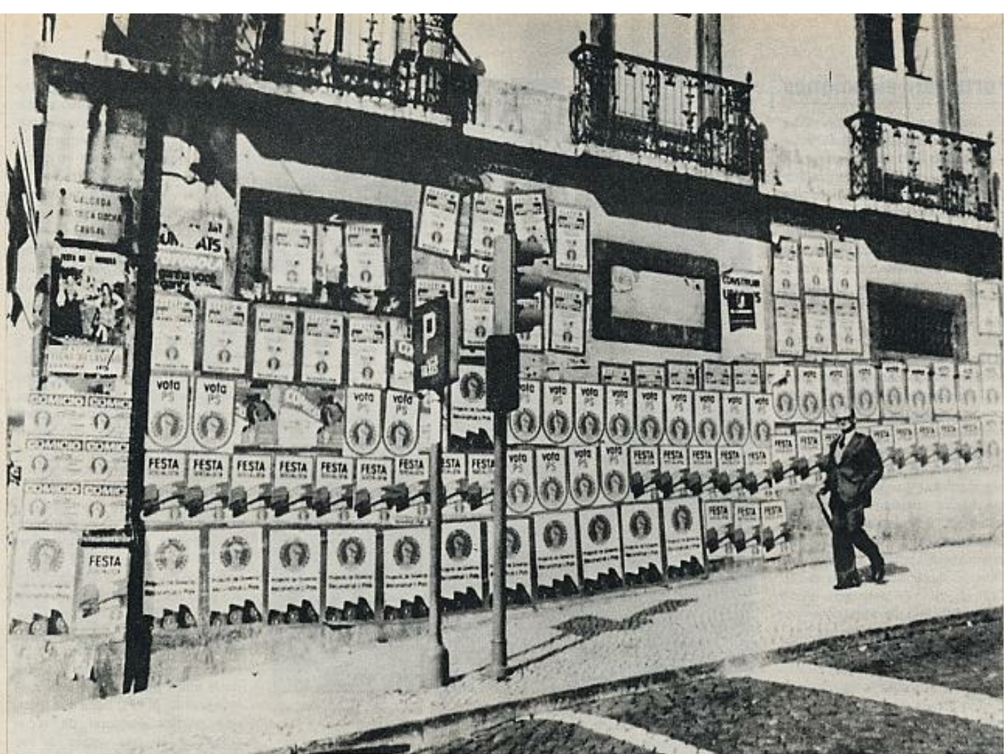
Carteles de propaganda electoral de los distintos partidos en liza tapizan estos días fachadas y paredes.

viço de Transportes, declaraba el día 2 de abril: "Como militar del 25 de abril de 1974 no puedo ocultar la enorme satisfacción y profunda emoción con que veo logrado uno de nuestros principales deseos y objetivos. No puede olvidarse que