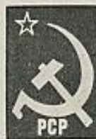
PCP (Partido Comunista Português)

El día 25 de abril permanecerá ininterrumpidamente abierto al centro Calouste Gulbenkian, donde los Ministerios de Comunicación Social y de Administración Interna tienen montado un centro de proceso de datos y el cuartel general de información sobre las elecciones (seis millones y medio de electores, mayores de dieciocho años). Allí acudirán cerca de mil periodistas portugueses y extranjeros para seguir en vivo la marcha de las elecciones, en el moderno edificio de la Fundación Gulbenkian, rodeado de uno de los más hermosos jardines de la Península. Estos son los catorce partidos que compiten en la lucha electoral: