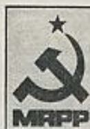
MRPP (Movimento Reorganizativo do Partido do Proletariado)