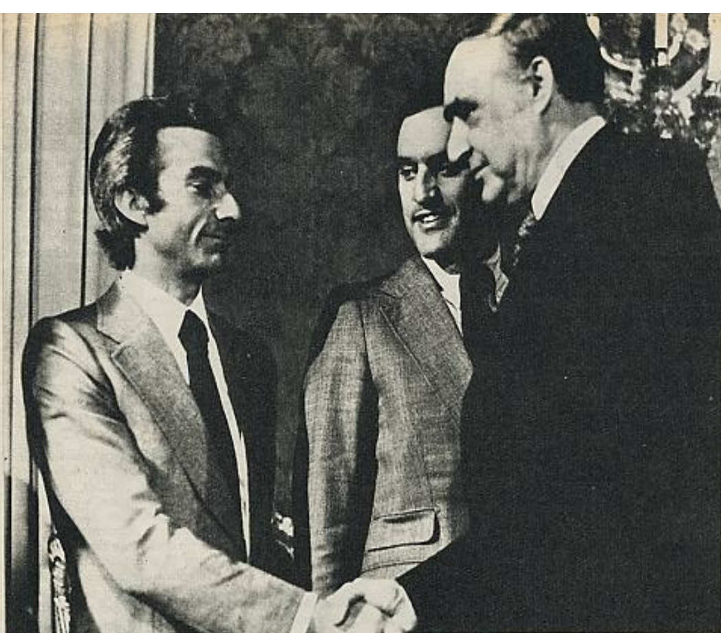
El Partido Popular Democrático es el único partido que podría adelantarse en votos al PS. En la fotografía, el secretario general del PPD, Sa Carneiro, con el ex general Spínola.

Tal vez los que se entiendan al final sean el CDS y el PPD. Y no parece lógica una gran coalición entre socialistas y pepedelistas, a juzgar por las declaraciones electorales. Claro está que una cosa es predicar y otra dar trigo. Queda abierto el camino a las cábalas y a las suposiciones, las combinaciones y las colocaciones. Portugal camina hacia un horizonte 1980. Y camina, al parecer, dejando de lado la ruptura del 25 de abril por la reforma de ahora. "La reacción no volverá. Nadie acallará la voz del MFA", afirma Vasco Lourenço (1). Queda por ver cuál sea esa voz del MFA, cuál sea la voz de los militares, que a lo largo de estos dos años han tenido muchos solistas y casi todos de diverso tono. Si es una, en cambio, la voz de las grandes organizaciones empresariales. Y es otra la voz de la socialdemocracia y el socialismo europeo reunido en Oporto. Está, por último, la voz del pueblo que hablará el domingo 25. ■ V. M. R.