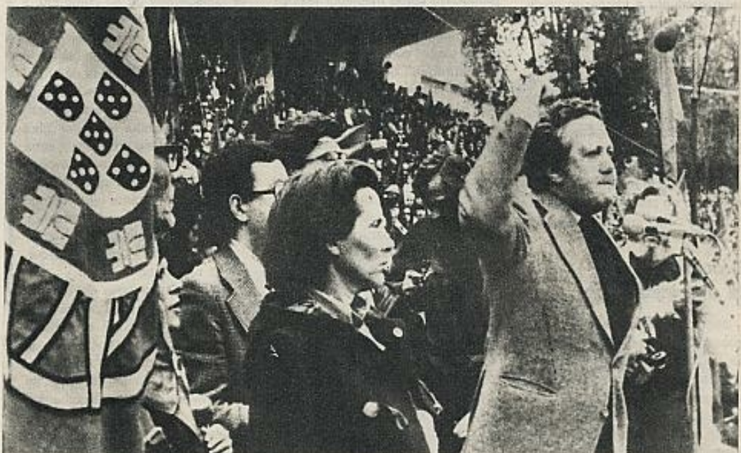
El Partido Socialista se presenta como "a grande alternativa da esquerda em Portugal". En la foto, Mario Soares, en un momento de su campaña.

Los militares parecen dispuestos a que se respete la Constitución. El brigadeiro Vasco Lourenço, gobernador militar de Lisboa, en una visita que hizo al Regimiento do Ser-