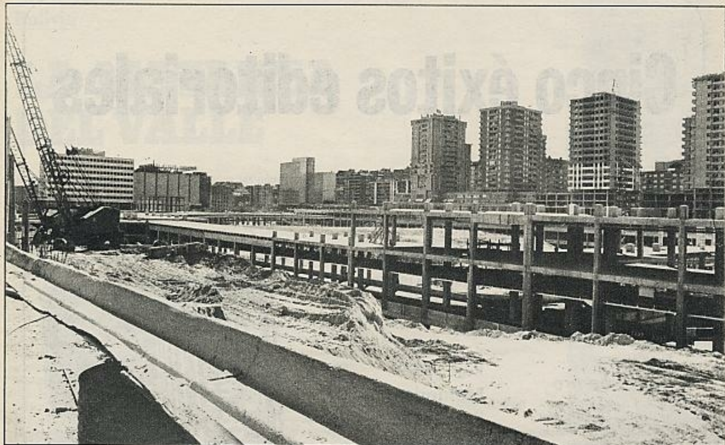
A nadie se le oculta que las necesidades de expansión industrializada de la empresa —obsérvese el trasvase de empresas constructoras a promotoras inmobiliarias como fenómeno inversor— representa para la arquitectura una ideología negativa.

dependiente, de las presiones político-tecnocráticas de la sociedad industrial.