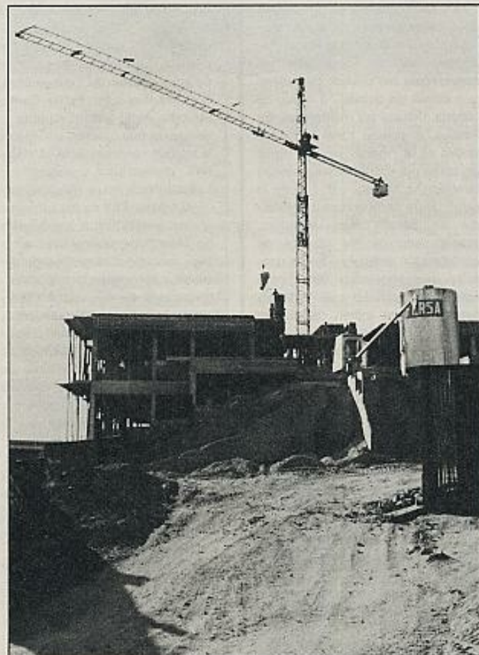
La arquitectura de la segunda mitad del siglo XX viene caracterizada por una falta de atención creadora.

Las condiciones imperantes del tiempo que nos toca vivir, más lúcidas por fortuna que algunos de los argumentos profesionales de esta controversia, clarificarán, sin duda, el proceso histórico de esta actividad humana dedicada a formalizar por el hombre el espacio ambiental de sus semejantes y que conoce-