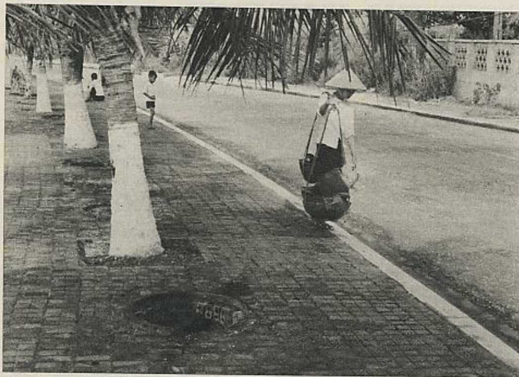
Sobre las aceras quedan todavía las entradas a los refugios individuales de la época de los bombardeos norteamericanos.

Ante la casa natal de Ho, medio sepultada en un bosquecillo de bambú y de papayos, preciso es evocar el recuerdo de este frágil aniquilador de Imperios, de ese Esopo constructor de naciones, mejor que al pie del solemne mausoleo de Hanoi, en el que, como se hiciera ya con Lenin, se ha colocado entre paredes de mármol su momia sacralizada. Una cabaña de barro y caña de bambú y de latania se levanta junto a una "casa" gemela, pero más amplia, que perteneció a los suegros del doctor Nguyen Sinh Soc, antiguo boyero que se hizo expendedor de medicinas tradicionales y curandero, y que fue hermano de un cierto Nguyen Binh Ling, llamado luego Nguyen Thut