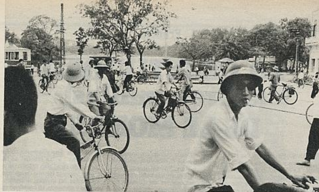
Hanoi, en la actualidad, sin la amenaza de las bombas.

lleva cerca de treinta años fuera de servicio, con excepción de algunos segmentos al Norte y al Sur, es uno de los grandes propósitos del poder recién inaugurado. Al igual que Mehdi Ben Barka pretendiera en 1957 hacer de la vía Fez-Tetuán la "ruta de la unidad" entre los dos fragmentos del Marruecos dividido por la colonización, los jefes de la revolución vietnamita tienen la ambición de convertir el Transvietnamita en símbolo, garantía y medio material de la reunificación.