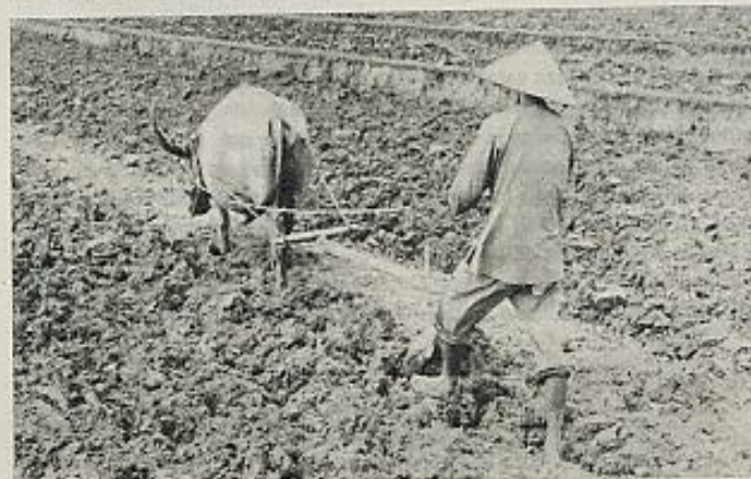
Arriba, los vietnamitas hacen cola ante el mausoleo de Ho Chi Min, inaugurado en septiembre de 1975; abajo, pasados los días de la defoliación sistemática, la tierra comienza otra vez a dar sus frutos.

una sociedad sudista fluida, semoviente y culpabilizada, y, por si fuera poco, corruptora, esa misma burocracia puede engendrar auténtica opresión.