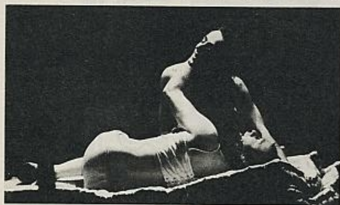
"Las criadas", de Genet.

transformaciones de Claire y Solange, el paso desde su desesperado diálogo de criadas a la ceremonia de sentirse señora y criada para explicitar lo que nunca habrían podido decirle a la señora verdadera, entrañaba una concepción insólita de la acción escénica. Una concepción difícil, que, sin embargo, fue inmediatamente imitada por numerosos dramaturgos, quizá porque con el juego de sus personajes Genet había desvelado el carácter sustancialmente teatral de la condición humana, cuanto hay en nuestra vida y en nuestras relaciones cotidianas de constante creación y modificación —un papel para cada antagonista y para cada situación— de nuestro personaje.