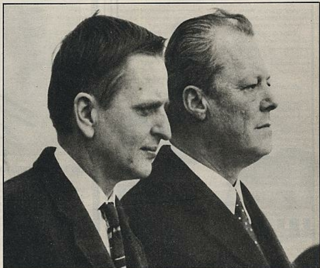
Palme y Brandt: el doble perfil del socialismo del Norte.

En su libro, Palme "matiza" a propósito de la autogestión. "Hay que verla bajo un ángulo práctico