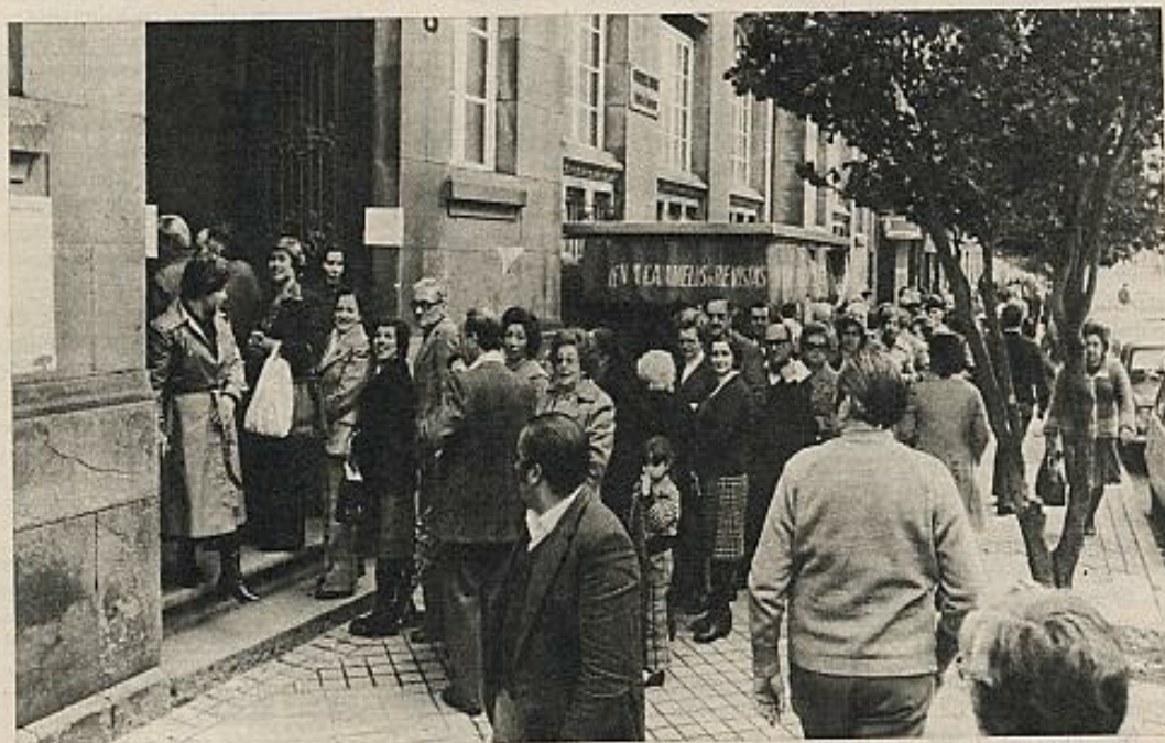
Alta abstención, difícil de explicar por apoliticismo o dificultades materiales en la votación, y homogeneidad "progresivista" son las notas sobresalientes del referéndum en Galicia. En la foto, colas de votantes ante un colegio electoral en Vigo.

podrían tratarse de algunas de las clásicas citas en estas explicaciones: apatía política o ignorancia, emigración, dificultad en las comunicaciones y asentamientos poblacionales dispersos, etc. En cuanto al primer aspecto, no puede decirse que sea mayor a la de cualquier zona rural y subdesarrollada española (y pienso en el caso de Extremadura, abstención del 19,1 por ciento, o de las provincias andaluzas, 18,8 por 100). La ignorancia política gallega no sólo no puede estimarse como mayor que en otras zonas rurales o subdesarrolladas de España, sino que yo me atrevería a decir que puede pensarse que es menor, y cualquiera que conozca Galicia puede avalar mi afirmación basada en el espíritu crítico-escéptico que es propio de nuestro pueblo y, más concretamente, de nuestro campe-