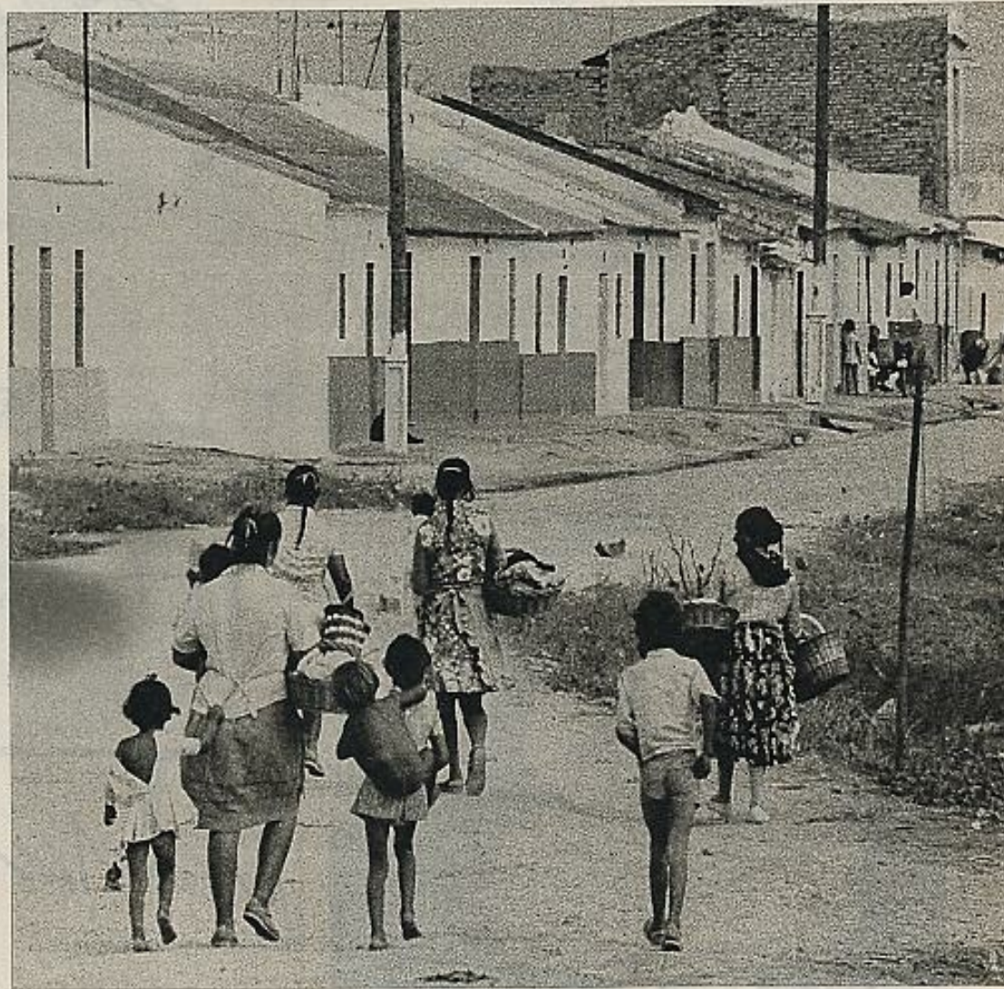
"Los andaluces debemos tener muy claro que para nosotros democracia y autonomía son términos

Al Bloque le han salido dos huesos, el Partido Socialista Obrero Es-