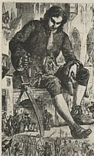
Gulliver en Lilliput.

te caso, no sólo es irrelevante, sino netamente desfavorable a Swift, pues se trata de enjugar una metedura de pata de Sir William Temple, quién para probar la superioridad sencilla y ática de los autores clásicos había esgrimido unas "Epístolas de Phalaris" que resultaron apócrifas. Swift, sin embargo, hizo una de-