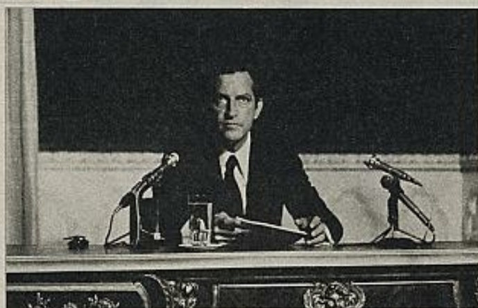
Adolfo Suárez: el camino más fácil.

La muerte del general Franco se produjo ya en una situación de crisis económica que se había iniciado a fines de 1973 y cuyo agudo y sostenido agravamiento debe relacionarse con el vacío de poder e incluso de administración inherente al final de todo dilatado régimen dictatorial. No obstante, a comienzos del presente año, y merced al impulso de la coyuntura internacional, se dejaron entrever algunos síntomas de recuperación que, aunque frágiles, resultaban propicios para una actuación decidida y eficaz de las autoridades: pero eso resultó algo fuera de las posibilidades y contrario a los intereses de un Gobierno protagonizado por el más claro reaccionarismo tanto en lo político (Fraga y su reforma concedida) como en lo económico (Villar Mir y su servidumbre a los sectores más conservadores del capital).