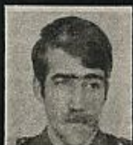
BAZTAN CARRERA Detenido el '77