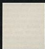
FELLO PASCON Detenido el '77