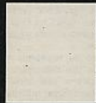
YARZA ECHINOUE Detenido el '72 Carcel de Cordoba