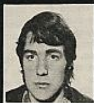
EGASA ARISTI Detenido el '76 Carcel de Valencia