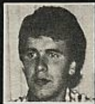
ALDANONDO Detenido el '77 Martorel