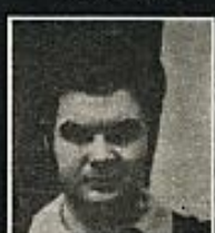
ONAINDIA NACHEONDO Detenido el '69 Carcel de Cordoba