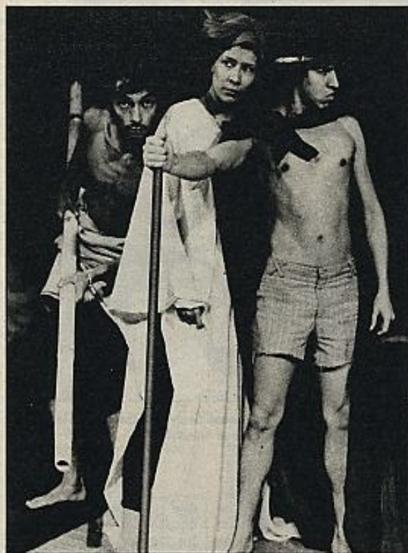
"Vida y muerte del fantoche lusitano", de Weiss-Buenaventura, por el TEC de Colombia.

en el ámbito del subdesarrollo y la colonización económica. Con cuya afirmación entramos ya en el otro punto: el de las relaciones entre compromiso ideológico y hecho artístico, entre militancia política y teatro, temas éstos que, contra lo que pudiera deducirse de un examen apresurado de ciertos montajes del TEC, preocupan muchísimo a Enrique Buenaventura por entender que encierran las causas de la pobreza estética de tanto teatro conceptualmente de la izquierda.