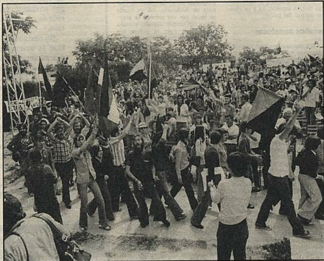
Hubo a lo largo del mitin de Jaén un aire de fiesta.