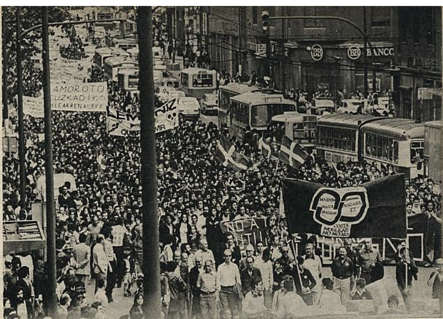
La manifestación contra las centrales nucleares superó en participantes incluso a la organizada, hace un año, a favor de la amnistía: 150.000 personas recorrieron con pancartas las calles bilbaínas.