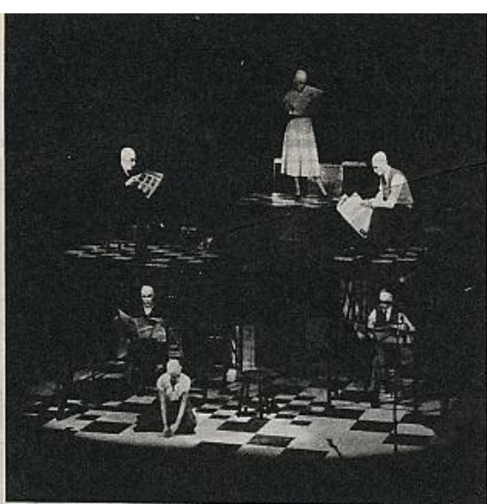
"Plany en la mort d'Enric Ribera": un texto excepcional en la moderna historia del teatro valenciano y un montaje importante para el teatro catalán.

contrar un camino por el que desarrollar la actividad propia de un verdadero centro de agitación cultural. Creo que la última fase de nuestro proceso ha sido similar al de toda la profesión; como tales entes, ambas Asambleas han muerto y yo creo que están bien muertas. Lo que quedan son sectores de personas que siguen luchando. A este nivel, me parece tan sumamente válida la labor del Lliure, como la que intentamos hacer nosotros, o la Villarroel en el plano de una programación teatral. Importa ahora que las diferentes instancias de la Administración no olviden los diferentes trabajos.