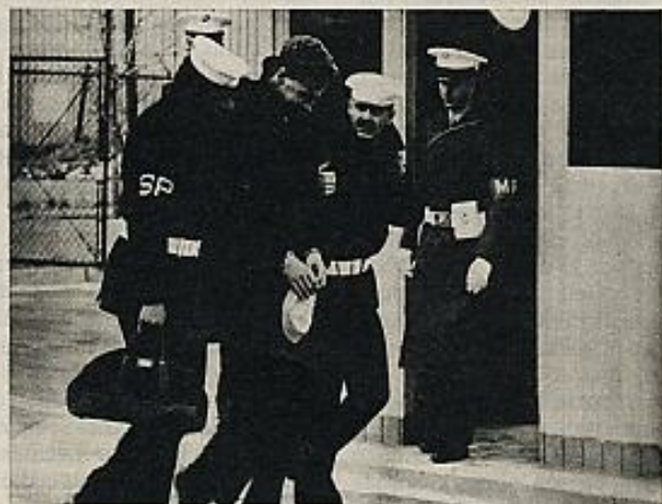
"El último deber", de Hal Asby.

Lo que en la película de Lazaga se eludía desgraciadamente, aquí forma el núcleo fundamental. Y sin que llegue a transformarse en una crítica dura de las estructuras militares que los tres sufren (o de cualquier estructura jerarquizada que obliga a unos hombres a realizarse mecánicamente, "El último deber" apunta suficientes datos como para con-