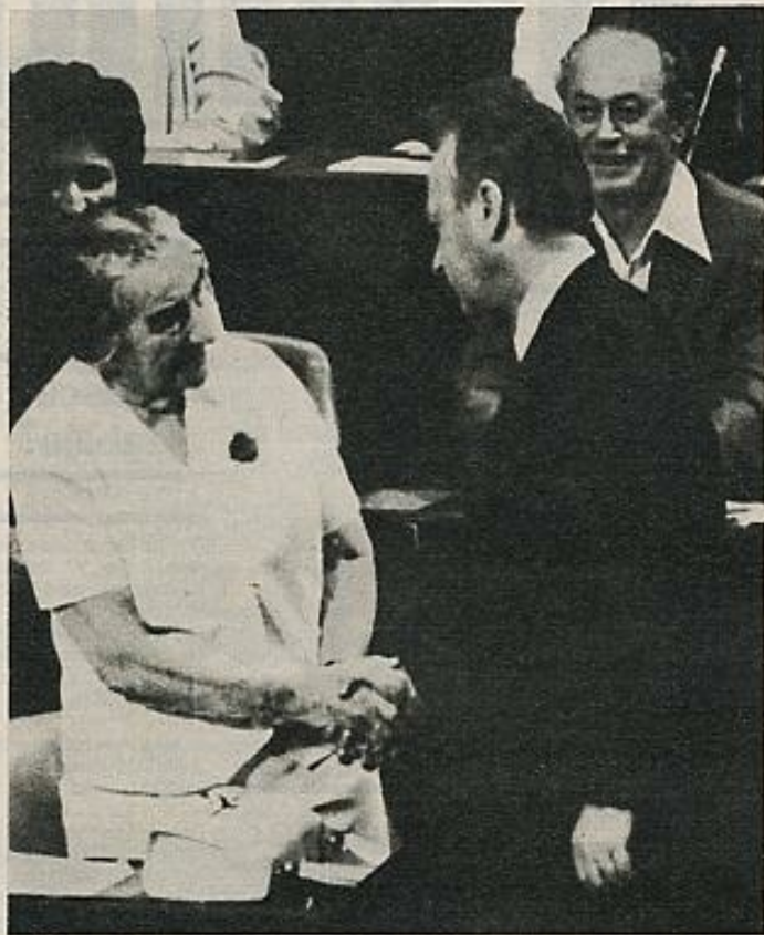
El Gobierno de Israel se opone a las negociaciones con la OLP a la que no reconoce como representante del pueblo palestino. En la foto, el primer ministro israelí, Isaac Rabin, con Golda Meir, la cual ha llegado a negar la existencia del pueblo palestino.

Un problema importante es, que siendo Israel un Estado internamente democrático y pluralista, los principales dirigentes de la coalición gubernamental se hallan, bajo