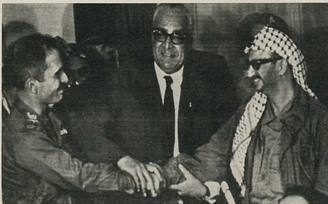
La actitud de Hussein de Jordania es ahora de acercamiento a la OLP. En la foto, a la derecha del Rey de Jordania con Yasser Arafat, izquierda, presidente de Al Fatah y de la OLP y el primer ministro de Túnez.

una u otra manera, fuertemente influenciados por un complejo militar, financiero y diplomático que no cree que la paz sea posible. El actual Gobierno, presidido por una "paloma" (Isaac Rabin), está muy influido por tres poderosos "halcones" (aunque todos ellos pertenecientes al mismo nido): Golda Meir, Yigal Allon (ministro de Asuntos Exteriores) y Simón Peres (de Defensa). Sus tesis son conocidas: nada de negociaciones con la OLP, a la que no reconocen como representante del pueblo palestino (Meir incluso afirma que no existe el pueblo palestino). Se trata de negociar con los Estados árabes, puesto que el conflicto es israelo-árabe y no israelo-palestino. Nada de cesión de territorios ocupados (y muy específicamente las alturas del Golán) sin tratados bilaterales con los países árabes vecinos, garantizados efectivamente. Discusiones bilaterales con cada uno de los Estados árabes por separado. No a cualquier negociación que pretenda ser ▶