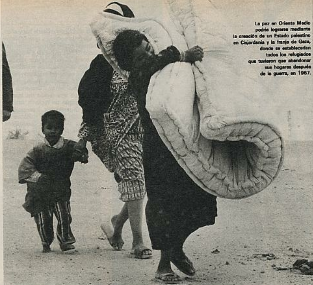
La paz en Oriente Medio podría lograrse mediante la creación de un Estado palestino en Cisjordania y la franja de Gaza, donde se establecerían todos los refugiados que tuvieron que abandonar sus hogares después de la guerra, en 1967.

Partiendo de la injusticia histórica que para los palestinos supuso la creación del Estado de Israel en 1948, de los esporádicos intentos de genocidio a que se les ha venido sometiendo y de la innegociable premisa del necesario reconocimiento de sus derechos nacionales, este artículo pretende limitarse a exponer el estado actual de la cuestión en lo que a la resolución del conflicto se refiere, desde la óptica de lo que podríamos denominar el "optimismo de Ginebra".