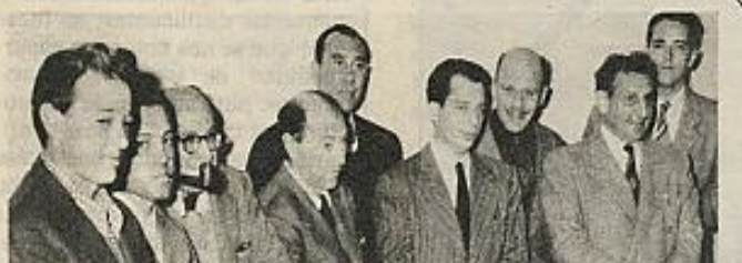
Nueve de "los diez de Hollywood" reunidos para presentar su declaración ante el Comité de Actividades Antiamericanas: de izquierda a derecha, Robert Adrian Scott, Edward Dmytryk, Samuel Ornitz, Lester Cole, Herbert Biberman, Albert Maltz, Alvah Bessie, JOHN HOWARD LAWSON y Ring Lardner. El décimo, Dalton Trumbo, había dado su palabra de presentarse al día siguiente.

Y aquí vienen ya mis preguntas. ¿Por qué "ha de ser" así la vida y la lucha del actor? ¿Qué sentido tiene "declararse inocente" desde la butaca? ¿Qué factores de la ordenación teatral determinan esta patética mezcla de fiereza y debilidad, soberbia y humillación, en el comportamiento profesional de los actores? Si Mankiewicz eligió el "campo teatral" no fue gratuitamente. En pocos campos —si exceptuamos el de los políticos profesionales o el de los toreros— podría encontrarse esa mezcla de fuerza y servidumbre, de gloria y destrucción, en que viven los personajes de la película. Pero, ¿no es cierto que ese "modo de ser actor" resultaría totalmente modificado si el teatro ganara la consideración de un "bien social"? Es decir, si el juego puramente privado se sustituyera por un "planteamiento público" de la profesión. El éxito saca al actor del anonimato y le da popularidad y dinero. ¿No es injusto que las "circunstancias favorables" se distribuyan con arbitrariedad? ¿Cómo esperar