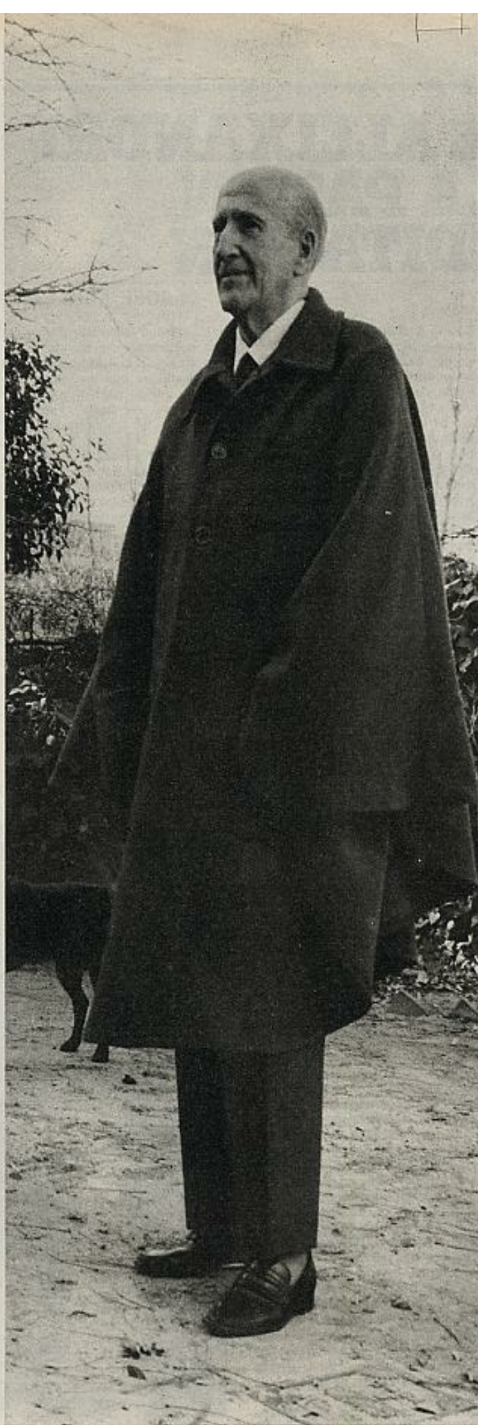
En su jardín de Velingtonia.

Reducido, forzado al recinto de Velingtonia, Aleixandre puja por el encuentro humano. Es también significativo que me se-