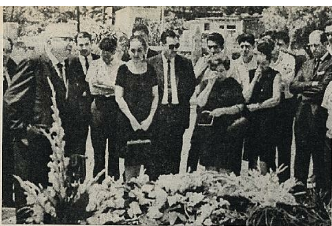
Entierro del poeta, en la ciudad mexicana de Monterrey.

afortunado: siquiera la verás. Que Dios te acompañe". Y en una posdata, explica esta invocación del alto símbolo de la divinidad católica, a la que de otra manera no le reza: "He nombrado a Dios. Creo en él como Bécquer, cuando pienso en usted como buen reflejo de la divinidad. Su sola persona ya es un milagro. Sea usted infinitamente bondadosa y deme una limosna de su presencia esta noche. Se me ocurre una copla: