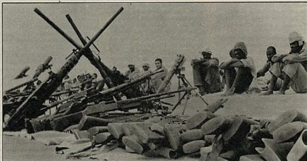
En el segundo aniversario de los "acuerdos de Madrid", la Administración española sigue manteniendo las ambigüedades y contradicciones que han sucedido al primer sentimiento de mala conciencia.

destacamento francés permanente, con doscientos nuevos llegados del territorio nacional. Especialmente se han incrementado los efectivos de observación aérea y unidades de choque.