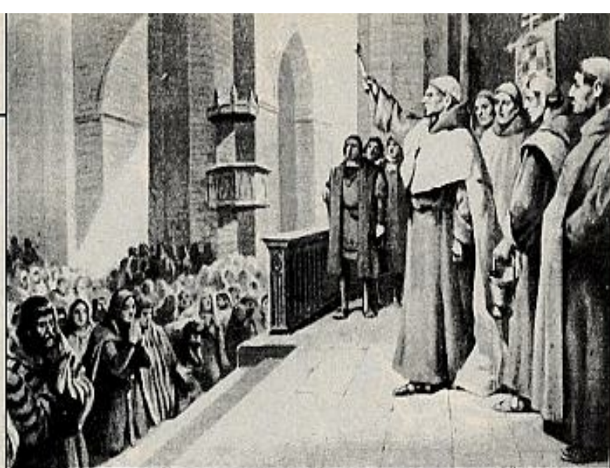
BAUTISMO DE MOROS EN GRANADA (AÑO 1499). El arzobispo Talavera iba realizando con dulzura, en Granada, la conversión de musulmanes; pero los intransigentes eran partidarios de obligarles a bautizarse sin delación, siendo el cardenal Cisneros de quienes abundaban en este parecer, y a la mentada ciudad se le envió para que ayudara con la predicación a Talavera, logrando convertir de momento a muchos, hasta el extremo de que hubo ocasión en que se recurrió a la aspersión para bautizar a la multitud.