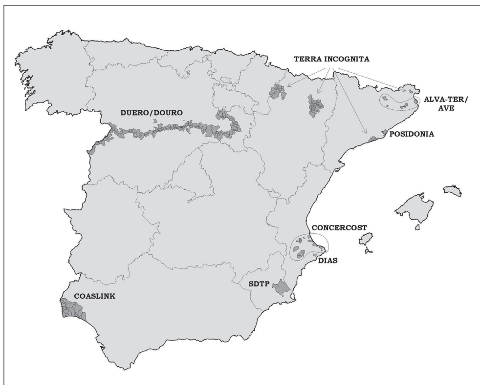
Mapa 1. Territorios españoles adscritos al programa TERRA