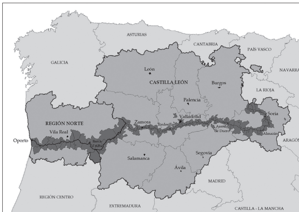
Mapa 2. Marco territorial del proyecto DOURO-DUERO, Región Fluvial