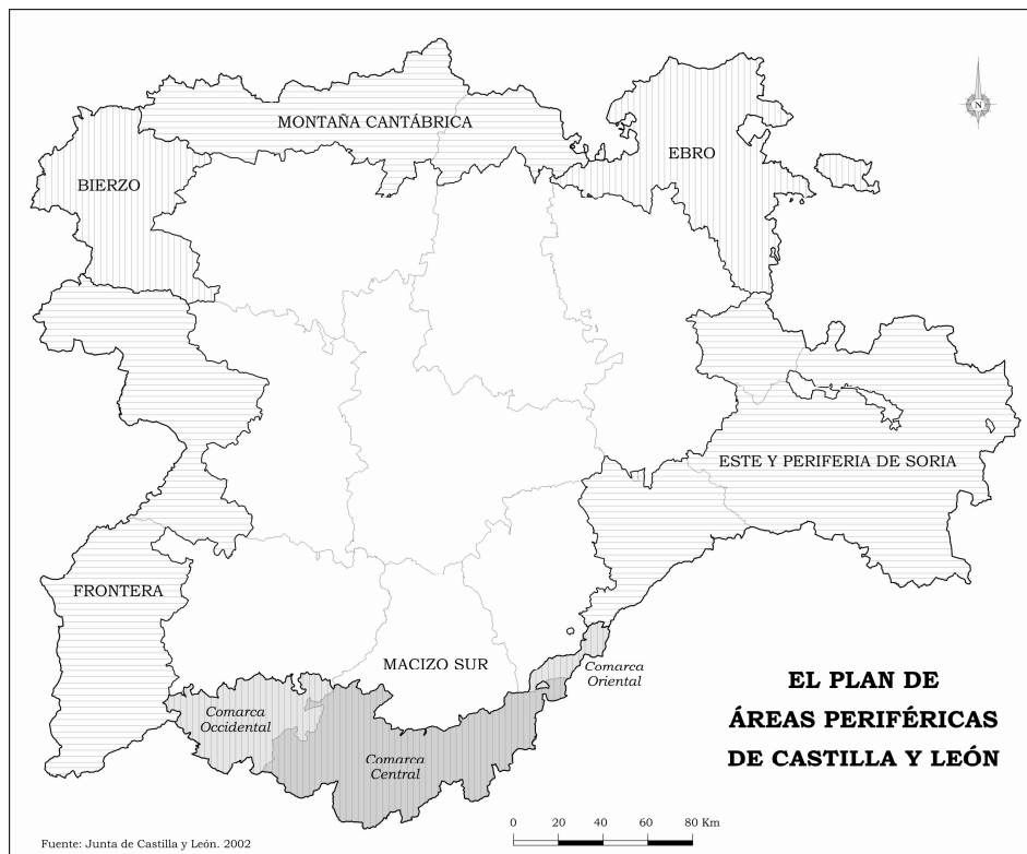
Figura 3.- El Plan de Áreas Periféricas de Castilla y León.

No obstante, la preocupación por las zonas de montaña no desaparece como tampoco sus problemas y así, entre diferentes actuaciones y propuestas cabe destacar que a finales del siglo pasado, ante la debilidad demográfica y económica que presentan y su posición en el borde de la comunidad autónoma, la Junta de Castilla y León inicia los estudios que desembocan en un plan de actuación conjunto para todas las áreas periféricas castellano leonesas, agrupadas en seis zonas: Bierzo, Montaña Cantábrica, Ebro, Este y Periferia Soriana, Macizo Sur y Frontera (los estudios iniciales fueron encargados en 1999 a distintos equipos de las Universidades de la región y la aprobación del Plan es de 4 de Octubre de 2002).