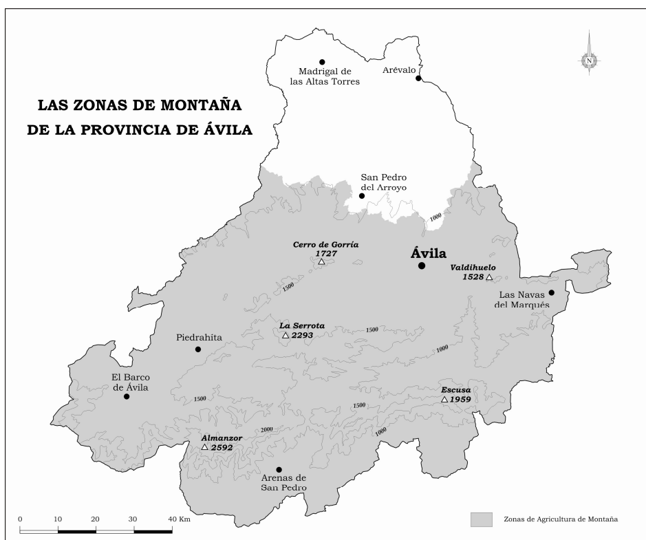
Figura 1.- Las Zonas de montaña de la provincia de Ávila.

Los contrastes altitudinales van desde los 2.592 m del Almanzor a los 300 m a los que el río Tiétar abandona la provincia de Ávila. Estas variaciones llevan aparejadas relieves tortuosos con fuertes pendientes, como sucede en toda la cara Sur de Gredos. Allí las gargantas y chorreras bajan turbulentas, no en vano en poco más de 15 kilómetros acarrear las aguas desde alturas superiores a los 2.000 metros hasta aproximadamente los 500 metros (pendiente media superior al 15%). Junto a estos relieves vigorosos encontramos zonas calmas de suaves perfiles, tanto en la culminación de La Paramera como en los valles de los principales ríos que