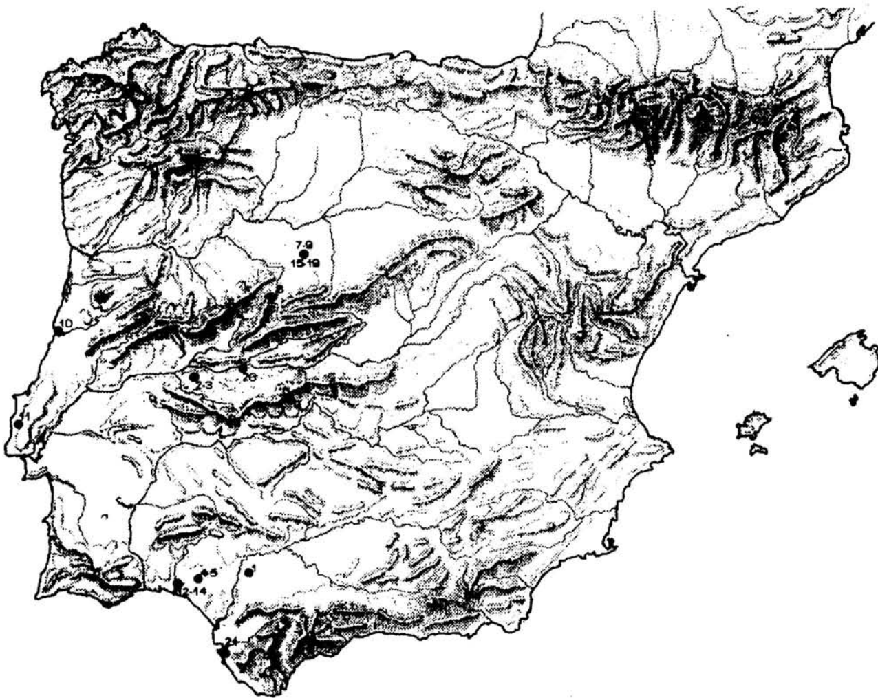
FIG. 1. Mapa de la distribución de los recipientes rituales con soportes de manos del tipo I u oriental. 1.- Cañada de Ruíz Sánchez (Carmona, Sevilla), 2-3.- La Alisea (Cáceres), 4-5.- Niebla (Huelva), 6.- Alrededores de El Berrueco (Salamanca), 7-9.- Los Castillejos de Sanchorreja (Avila), 10.- Santa Olaya (Figueira da Foz, Portugal), 11.- Torres Vedras (Torres Vedras, Portugal), 12-14.- La Joya (Huelva), 15-19.- Los Castillejos de Sanchorreja (Avila), 20.- Las Fraguas (Toledo), 21.- El Cortijo de Vaina (Cádiz).

En el caso de las necrópolis tartésicas, Ruiz Delgado (1989) señala que el material arqueológico disponible no permite identificar un ritual funerario con una clase social determinada, ya que los ajuares más ricos y espectaculares pueden aparecer tanto en inhumación como en incineración, y tanto en tumba plana como en túmulo. A pesar de esto, no podemos negar que la existencia de una diferenciación social es evidente en las necrópolis más estudiadas. En este sentido, dentro de los conjuntos funerarios se dejan entrever algunas sepulturas determinadas