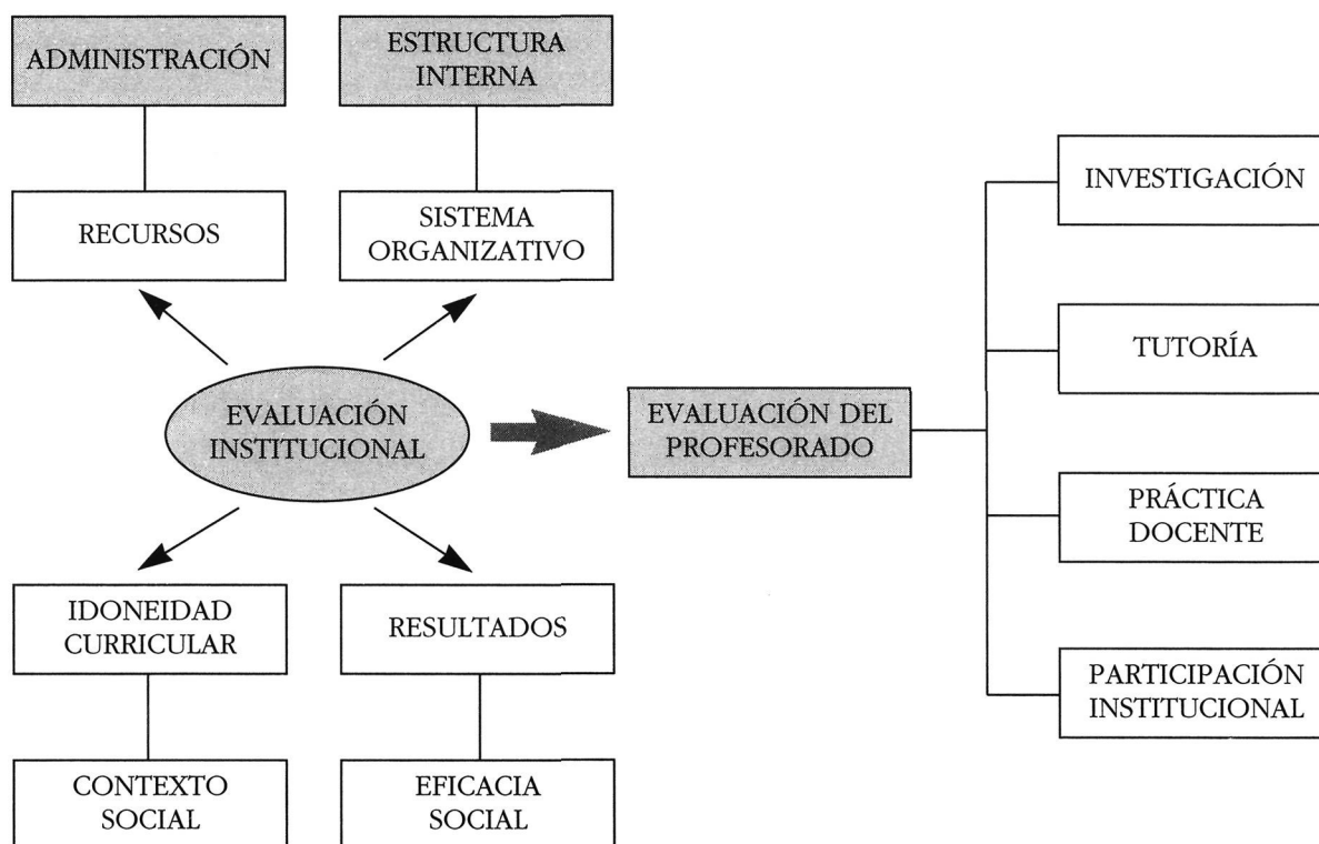
GRÁFICO 1. Modelo de evaluación del profesorado universitario.

Las encuestas serán aplicadas por agentes externos a la universidad, quienes procesarán los datos y los remitirán a la Comisión de Evaluación, que a su vez los comunicará al profesorado correspondiente.