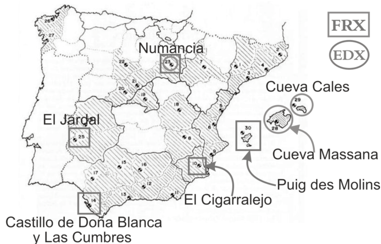
FIG. 2. Mapa de España en el que se representa la distribución espacial de los yacimientos de cuentas de vidrio prerromanas. Las distintas técnicas de análisis se identifican en función de la traza empleada: Círculo = EDX. Cuadrado = FRX (Ruano, 1996).

Numancia , Garray, Soria. Necrópolis descubierta en 1993 en la falda NE del cerro donde se asienta la ciudad celtibérica y cuyos enterramientos en los que aparecieron cuentas de collar en vidrio se han fechado en el siglo II a.C.