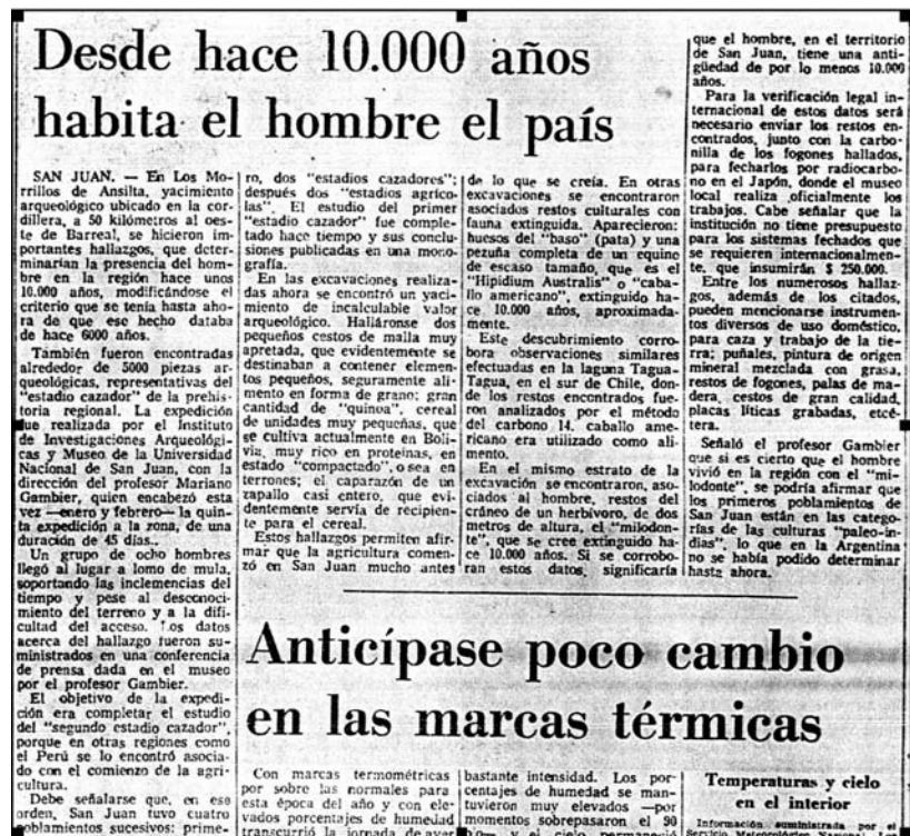
FIG. 1. Figura 1-Nota del diario La Nación (Buenos Aires), 7 de marzo de 1977, sexta página.

años” en La Nación (Buenos Aires), 26 de enero de 1984, décimo novena página; “Desde hace 10.000 años habita el hombre el país” en La Nación (Buenos Aires), 7 de marzo de 1977, sexta página; “Diez mil años de arqueología argentina” en La Nación (Buenos Aires), 14 de junio de 1980, onceava página; “Restos humanos de hace un siglo hallaron en el Neuquén” en La Nación (Buenos Aires), 12 de junio de 1979, décimo séptima página. Y con respecto a los temas que salen de lo cotidiano destacamos: “Se estudia la momia hallada en Catamarca” en La Nación (Buenos Aires), 26 de abril de 1976, novena página; “Una momia en Calingasta” en La Nación (Buenos Aires), 28 de marzo de 1978, sexta página, entre otras notas.