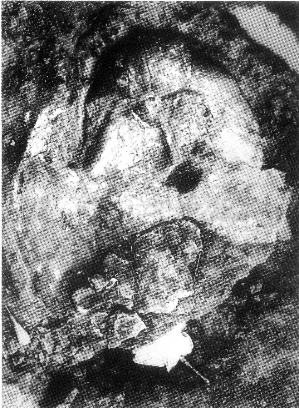
Fig. 1. GEOCHELONE BOLIVARI (HERNÁNDEZ PACHECO & E., 1917; emend. ROYO 1935) ( x 1/9)

ño (este individuo presenta fontanellas pleuro-periferales aún abiertas, aunque casi están cerradas, propias de un joven casi adulto), sito hoy en el Museo de Sabadell, y con los esquemas de un espécimen de Palencia (ROYO GÓMEZ, 1935, Fig. 4) adulto, aproximadamente del mismo tamaño que el 2414. El espaldar de éste podría