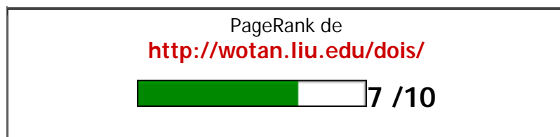
Rango de página

“Google no vende la ubicación de los resultados en sí (es decir, nadie puede comprar un PageRank más elevado). Una búsqueda Google es una forma sencilla, honesta y objetiva de encontrar sitios web de alta calidad con información relevante para su búsqueda.”