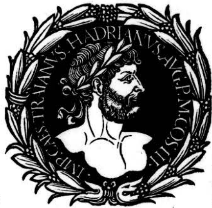
Adrian. græ- ce & latine eruãitus

Quæ ad artus Adriano prin- cipi, Eusebiana sacra inuisen- ti librũ pro no- firare religione tradidit, & tã- te admiratio- ni fuit, ut aper- sequitioe gra- uissima illius sedaret ingeni- um R. Volate.