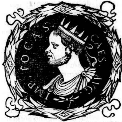
Ἰωάννης, templum omnium deorum Romæ post hac Maria rotunda dictum.