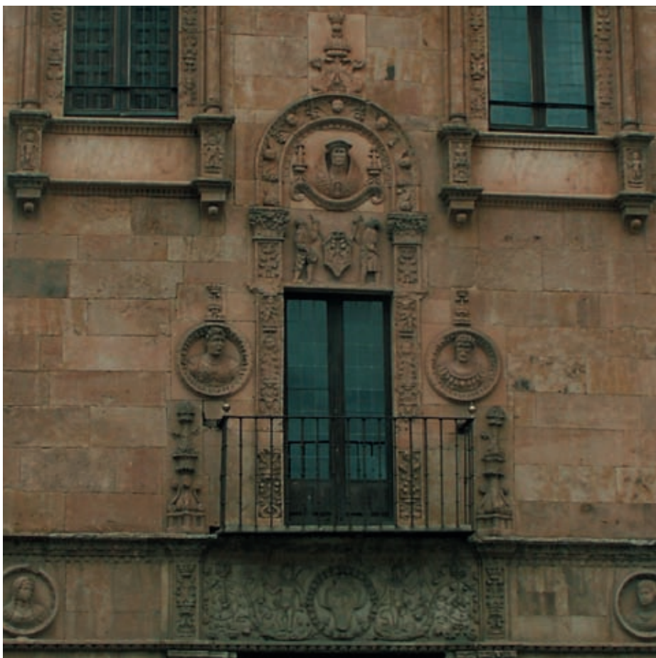
Figura 3. Dinteles de la puerta y balcon con el escudo Anunciabay