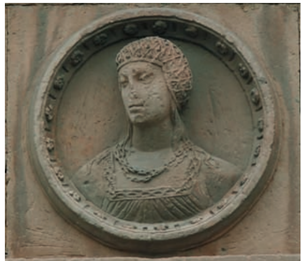
Figuras 6 y 7. Medallones femeninos de la Casa de las Muertes.