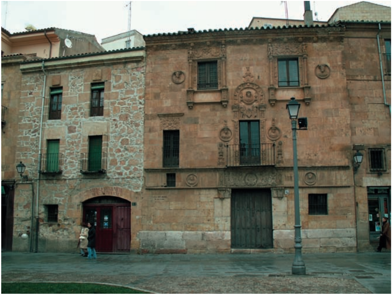
Figura 2. La Casa de las Muertes y la contigua «del arco», propiedad de Juan de Álava.