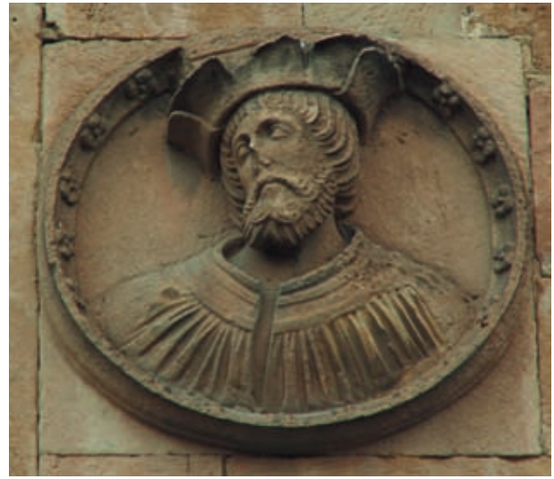
Figuras 4 y 5. Medallones masculinos de la Casa de las Muertes.