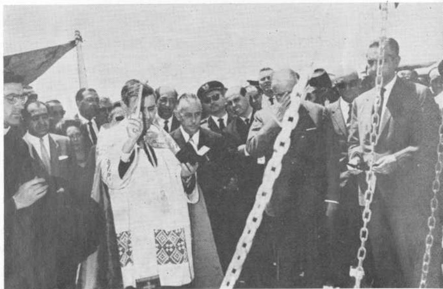
Bendición de la primera piedra de la nueva Facultad de Ciencias (19 de junio de 1965).