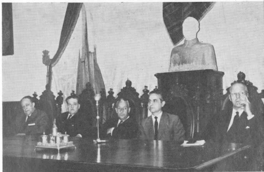
Presidencia del Acto académico de inauguración del II Curso de Verano para extranjeros (5 de julio).