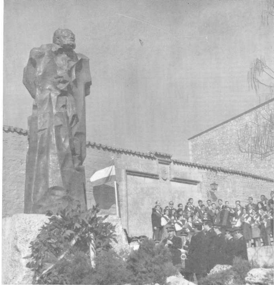
Actuación del Coro Universitario en el descubrimiento de la estatua de D. Miguel de Unamuno (30 enero de 1968).