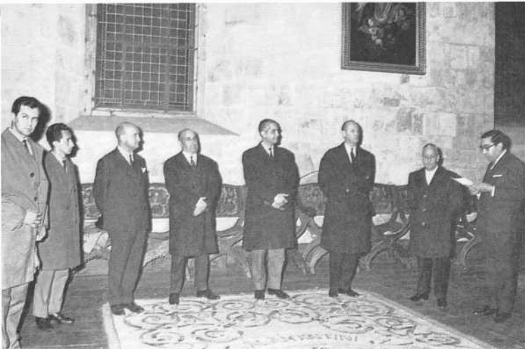
Clausura de las Primeras Jornadas Culturales de los Estados Unidos de Norteamérica de Salamanca, con asistencia del Excmo. Sr. Mr. Angier Biddle Duke, Embajador de los Estados Unidos de Norteamérica en España (23 febrero de 1968).