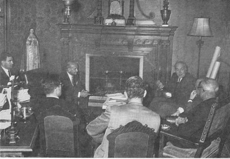
Visita de una Delegación de la Universidad de Cambridge a la Universidad de Salamanca (7 noviembre de 1967).