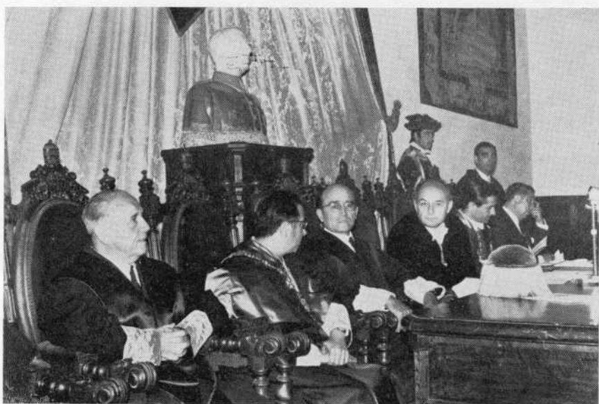
Jornadas en Salamanca de los actos conmemorativos del I Centenario de la Ley Orgánica del Poder Judicial. Presidencia del acto en el Paraninfo.