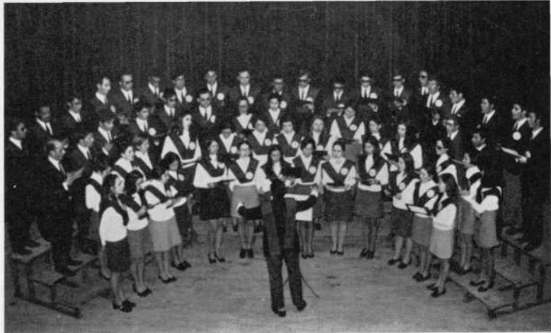
Actuación del Coro Universitario en Placencia, en el marco de las V Jornadas Médicas organizadas por la A.S.U.S. con el patrocinio de la Facultad de Medicina de esta Universidad, del Colegio de Médicos de Cáceres y del Secretariado de Extensión Universitaria de la Universidad.