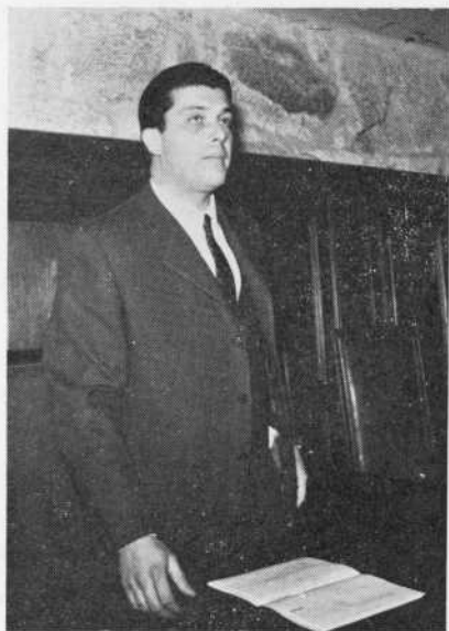
Prof. F. Mayor Zaragoza, Catedrático de Bioquímica de la Fac. de Farmacia de la Universidad de Granada. Intervención en el Curso sobre Biología Celular organizado por el Depto. de Microbiología y el Instituto de Biología Celular de C.S.I.C.