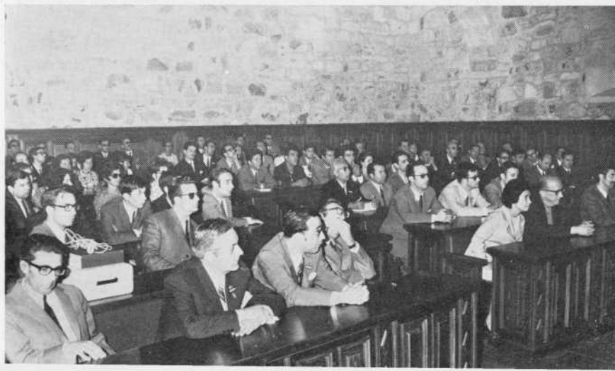
III Reunión Luso-SCAL de Pediatría. Sesión en el Aula Miguel de Unamuno.