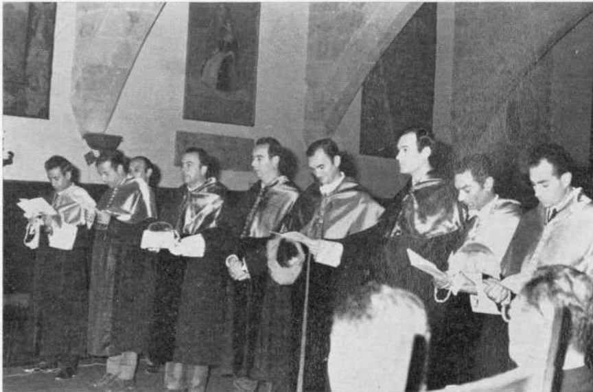
Inauguración del Curso Académico: Investidura de Doctores.