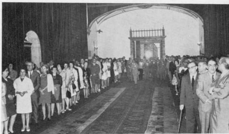
VIII Asamblea Anual de la A.S.U.S.—Misa en la Capilla de la Universidad.