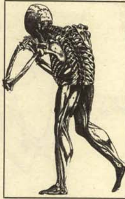
Un reportero gráfico pudo obtener esta instantánea, por la espalda, del hombre hallado en Villacarca del Bierzo.