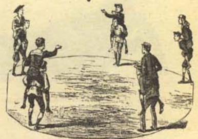
2.—Utilización de los niños pobres como cabalgadura, para que nuestros hijos jueguen felizmente en las calles empedradas que nos circundan.