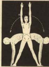
b) Ejercicios más rudos para temporadas tempestuosas.