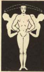
a) Ejercicios moderados para temporadas de calma.

Todas las mañanitas, con la ventana abierta a los aires polucionados de la localidad, los centristas deben hacer los siguientes ejercicios gimnásticos para mantenerse elásticos y eriguídos sin caer en las tentaciones de la derecha o de la izquierda.