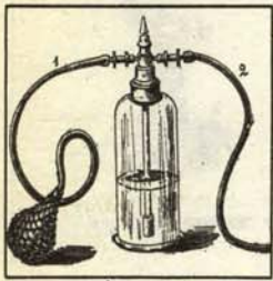
c.—Siga inoculándose, disolviendo en agua destilada o ras aleccionadas que sin duda poseerá usted en su biblioteca.