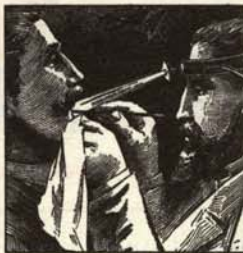
b.—En cuanto sienta el primer síntoma acuda al primer dispensario para una higienización de urgencia.