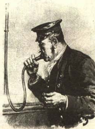
Supuesto bigamo sorprendido en el momento en que sopla por un tubo con intenciones hasta el momento desconocidas.