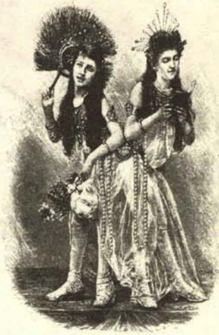
Hermanas siamesas casadas con el señor acusado de bigamia.

Un caballero, casado con unas hermanas siamesas, ha sido acusado públicamente de bigamia. No se sabe en qué parará la cosa, porque hay muy poca jurisprudencia sobre el asunto. De momento las cosas siguen su curso.