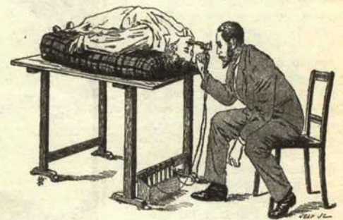
Hija también en posición horizontal en la exploración citada.